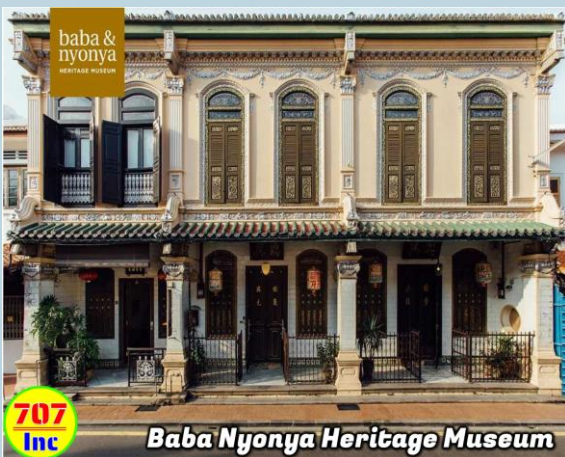
Baba Nyonya Heritage Museum