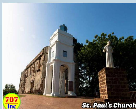
St. Paul's Church