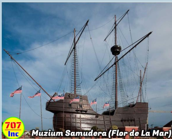
Muzium Samudera (Flor de La Mar)