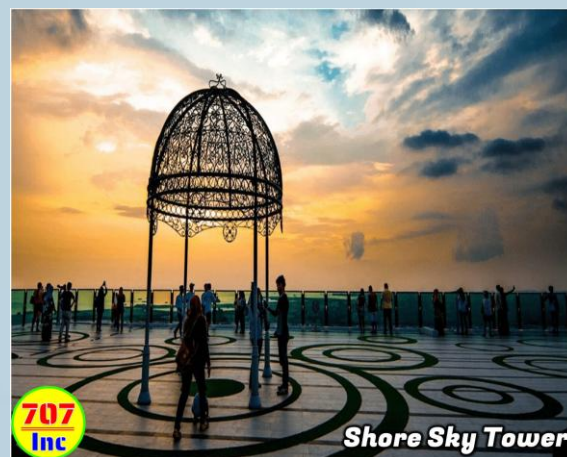
Shore Sky Tower