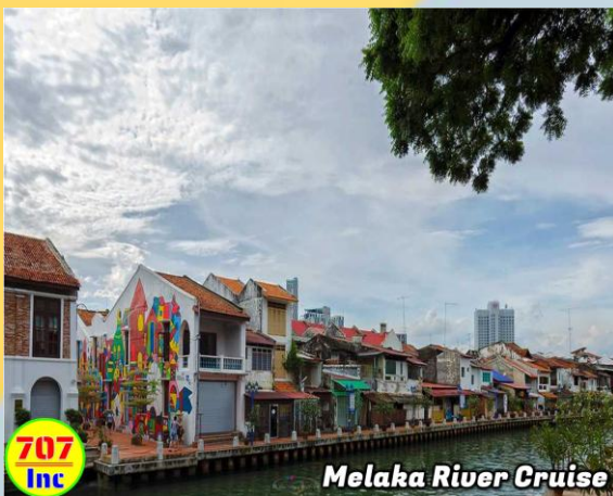
Melaka River Cruise