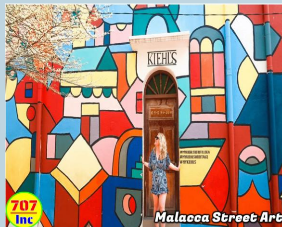
Malacca Street Art