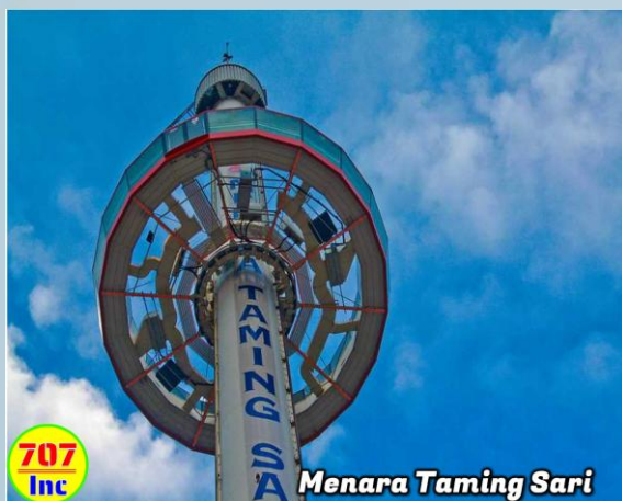
Menara Taming Sari